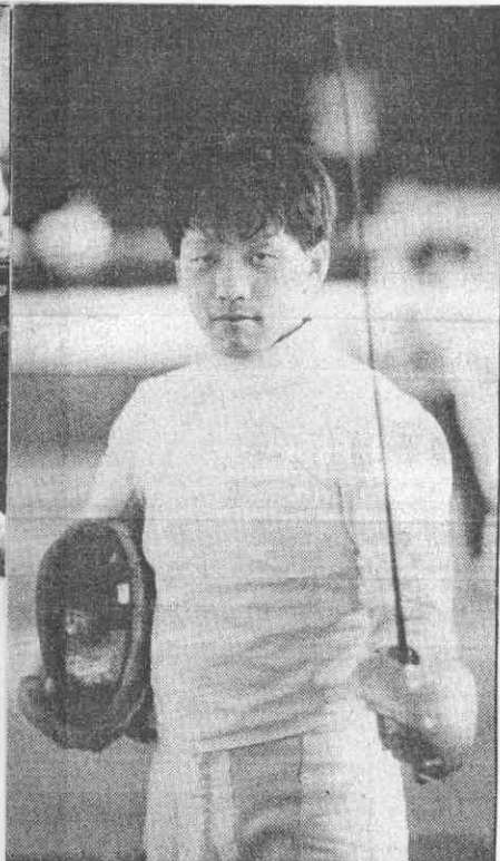
。'逃而風望人敵，手在刀一盛宗劉↑ (攝興福張 者記報本)