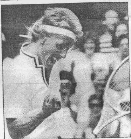
選國美敗擊娃諾提拉娜剛金女↑ (真傳社聯美)。強四身躋，絲格梅手