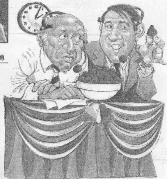
特頓布溫嘗品空抽要都員報播視電連 ↑ 。每草油奶一產