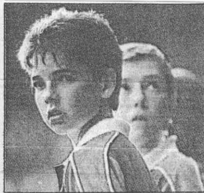
的賽球網頓布溫是，紫和綠 ↑ 。表代為堪童球，色顏統傳

●如果有九二二年全英俱樂部便從瓦柏路搬到教堂路重新開張，以迄至今。 六十多年來，全英俱樂部屢經擴張，不過最早的建設藍圖是由史丹利·皮曲依現址所規劃設計的。目前全英俱樂部有一面可容一萬四千多名觀眾的中央球場，八千多名觀眾的第一球場，及另十六面場地，加上附屬設施如停車場、俱樂部辦公室等，全部佔地達四十二英畝。 全英俱樂部最出名的就是這十八面球場的草皮，堪稱舉世第一。固定有十名工作人員負責照顧維護，每年都要重種一次。（本報特派記者 劉延青）