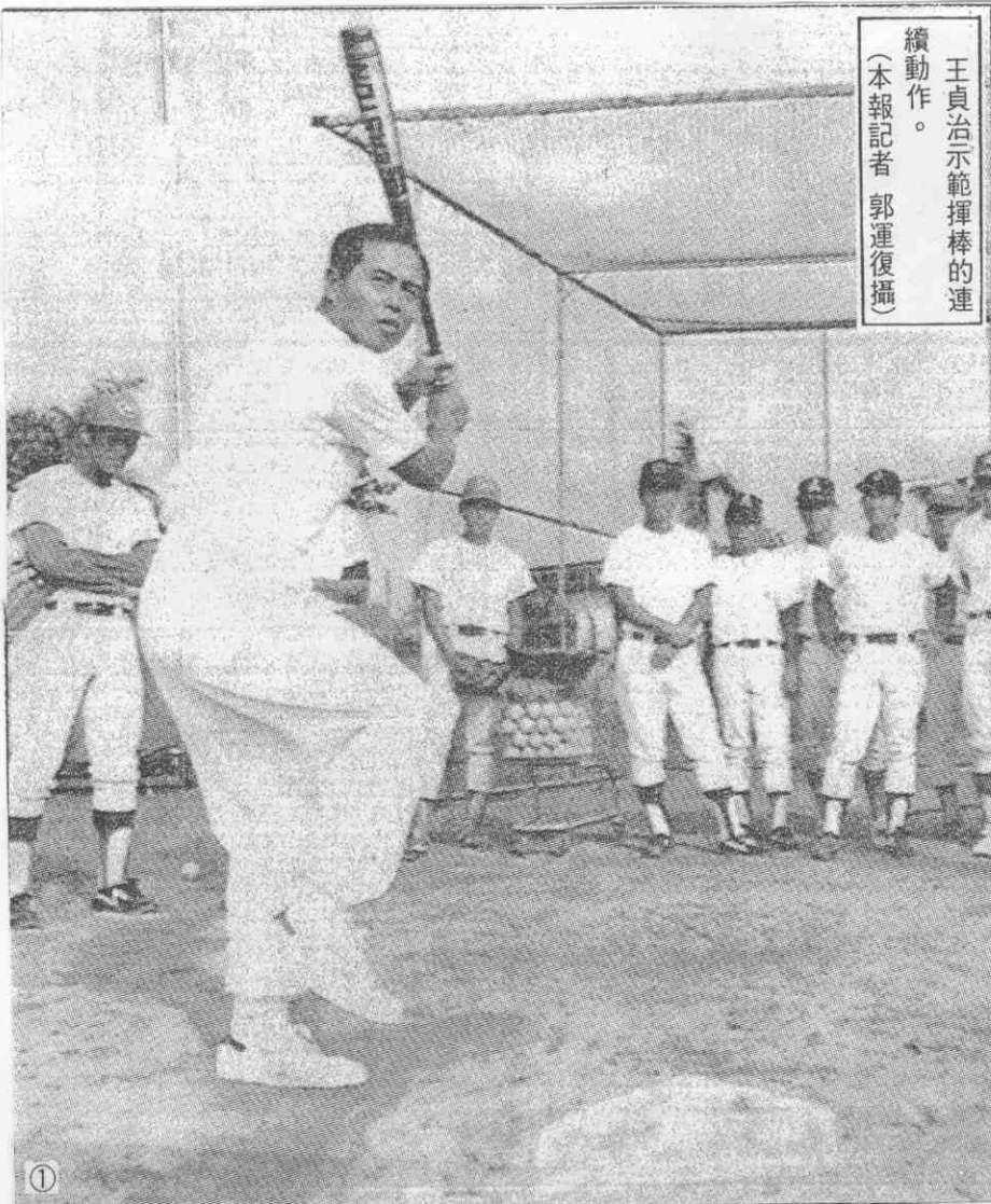
王貞治示範揮棒的連續動作。