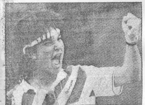
↑西班女將桑琪士與葛拉芙爭奪法國公開賽后冠時，不絕揮拳，叫吼激勵自己。此役她果然獲勝。

【本報綜合外電報導】葛拉芙的衛冕心願。歷經一番苦戰，十七歲西班牙女將桑琪士昨天大爆冷門，以七比六（八比六）、三比六、七比五力克世界排名第一的「西德玉羅利」葛拉芙，奪得法國網球公開賽后冠，打破賽就表現威風凜凜，昭示了她扳倒世界第一高手的跡象。 這場爭后戰，因而延後了廿分鐘才展開。桑琪士在她頭兩個發球局中，曾三度被葛拉芙拿到「破發點」(Break Point)，但她都轉危為安的守住發球局，而後並趁葛拉芙失常的打不出她凌厲正拍的機會，破了葛的發球局，以三比二取得領先。 第六局，葛拉芙錯失五個「破發點」，被桑琪士再下一城，四比二，桑琪士佔盡優勢。 然而「玉羅利」隨後逐漸恢復神勇本色，以六比五超前。 第二盤葛拉芙雖扳回一城，但決勝盤「玉羅利」再度陷於常生失誤的困境，被桑琪士奪走勝利。