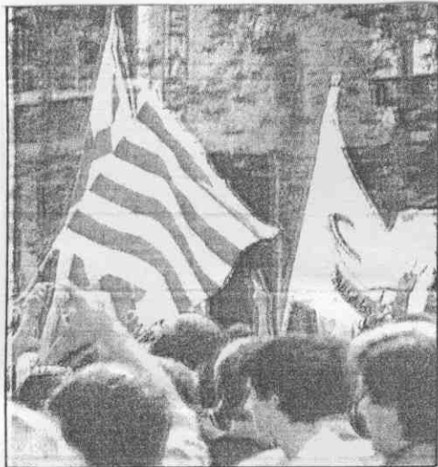
。權辦主運奧得取祝慶衆民納隆塞巴 ↑