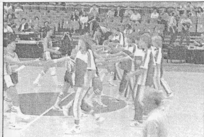
中華女籃(左)在一九八六年與匈牙利女將曾有交手紀錄。

處可用之地，而且觀光旅館的容量及服務應不成問題。 至於票房的考量，今年若果真邀成東歐隊伍來華，號召力自然大增，其他中華對日本、韓國、菲律賓勢必場場爆滿，遇到較冷門球賽時，何不仿與當地政府教育局協調，邀請各級學校師生觀戰，亦可收致落實推展地方籃運之效果。 彰化及台南市地方籃壇人士，有高度的熱忱承辦瓊斯杯，並也承諾可提供部分經費；另有運動經紀公司也願在台南舉辦，全國籃協在台北不行的窘境下，何妨讓瓊斯杯南下呢？