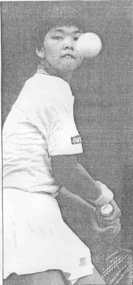
國全下拿，勝得球抽拍正榮長巫↓ 。軍冠賽名排