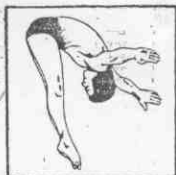
世界盃跳水公開賽