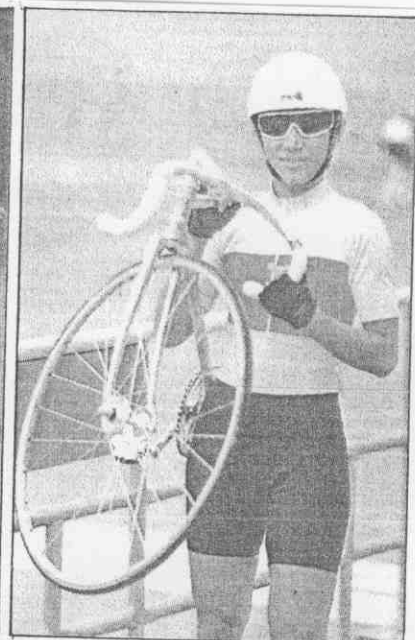
手國車由自 拔選期一第