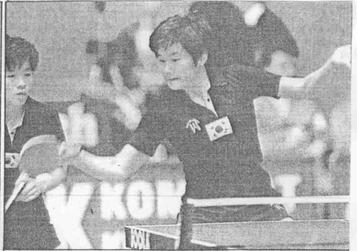
◀淑美權人新配搭，將主一第韓南是(右)和靜玄◀