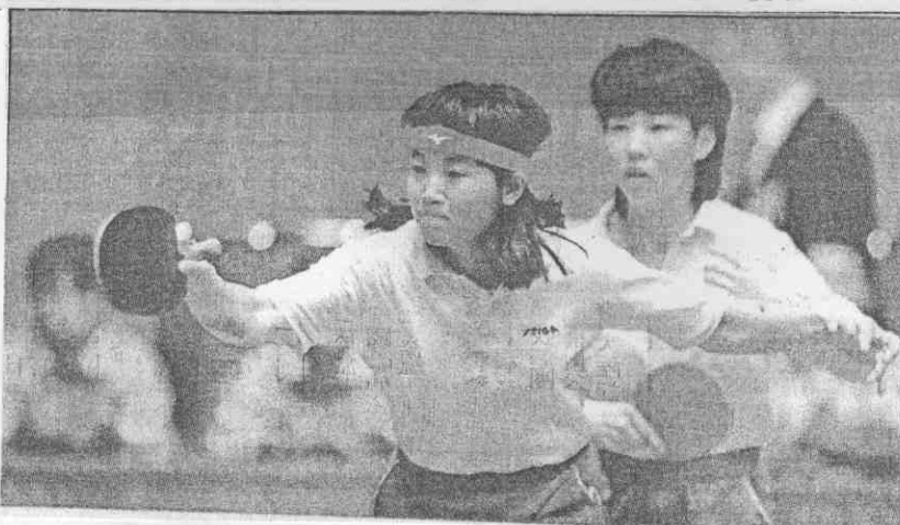
◀(左)華寶齊港香 ◀兵備陸大是蕾丹陳和