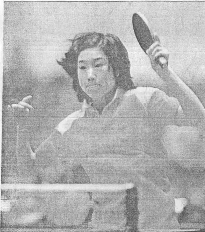
免難，夢美的軍冠單女桌世和牌金運奧圓能未靜陳 ◀ (攝復運郭 者記報本) ◀望失