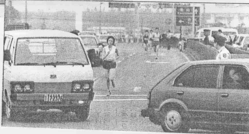
▲ 林口交流道交通管制不佳，人車爭道影響比賽品質。