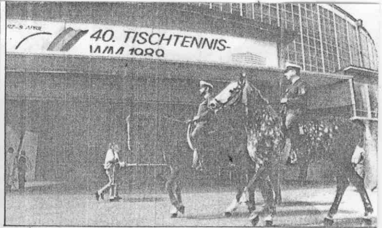
可時隨場會，嚴森備警賽球桌界世▲ 。邏巡馬騎察警見