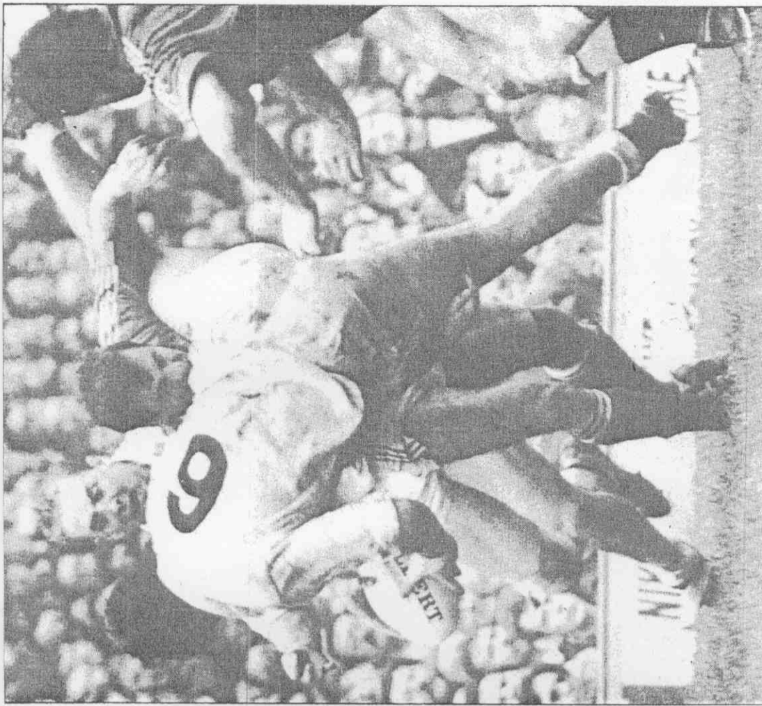
《歐洲五國橄欖球對抗賽》