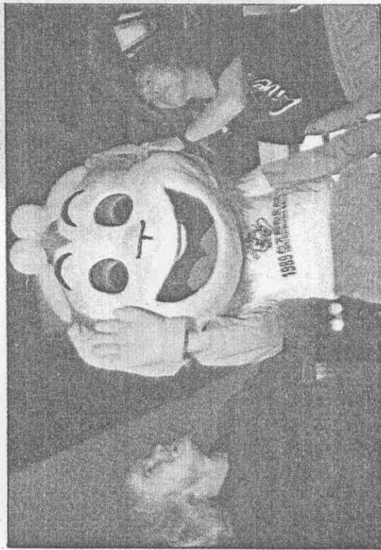
玩物祥吉會大春運(左)特考史與(右)珠殷林將女國韓

▲明天清晨，兩萬名跑者將和波札那選手雷克哥巴一起回個人的體能及毅力挑戰。