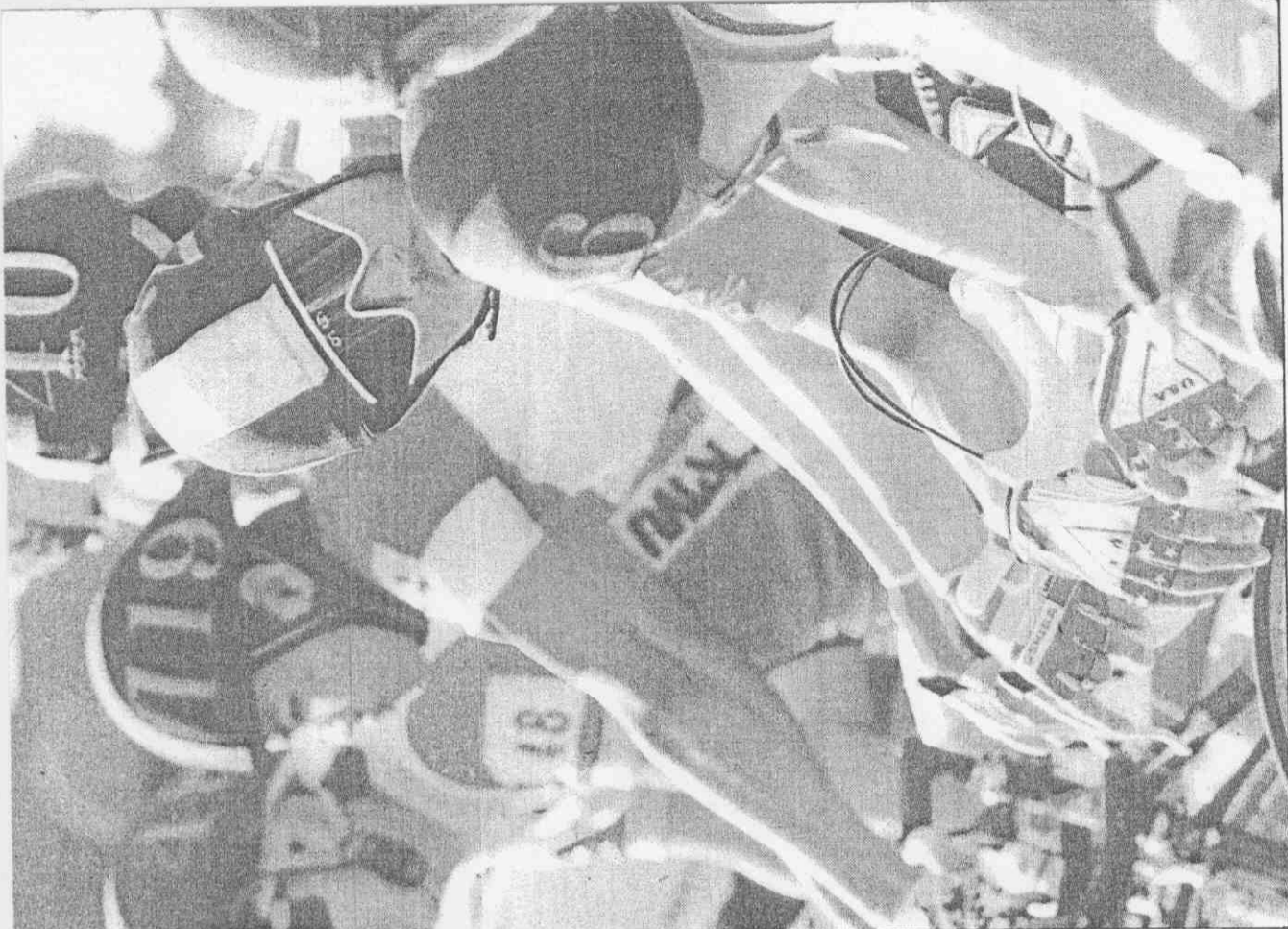
(攝復運郭 者記報本)。發待勢蓄手車由自國各，前賽圍繞雄高