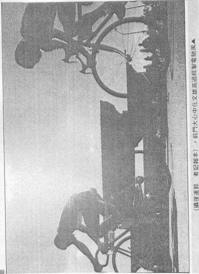
(攝復運郭 者記報本)。前門大心中化文雄高過經學電馳風