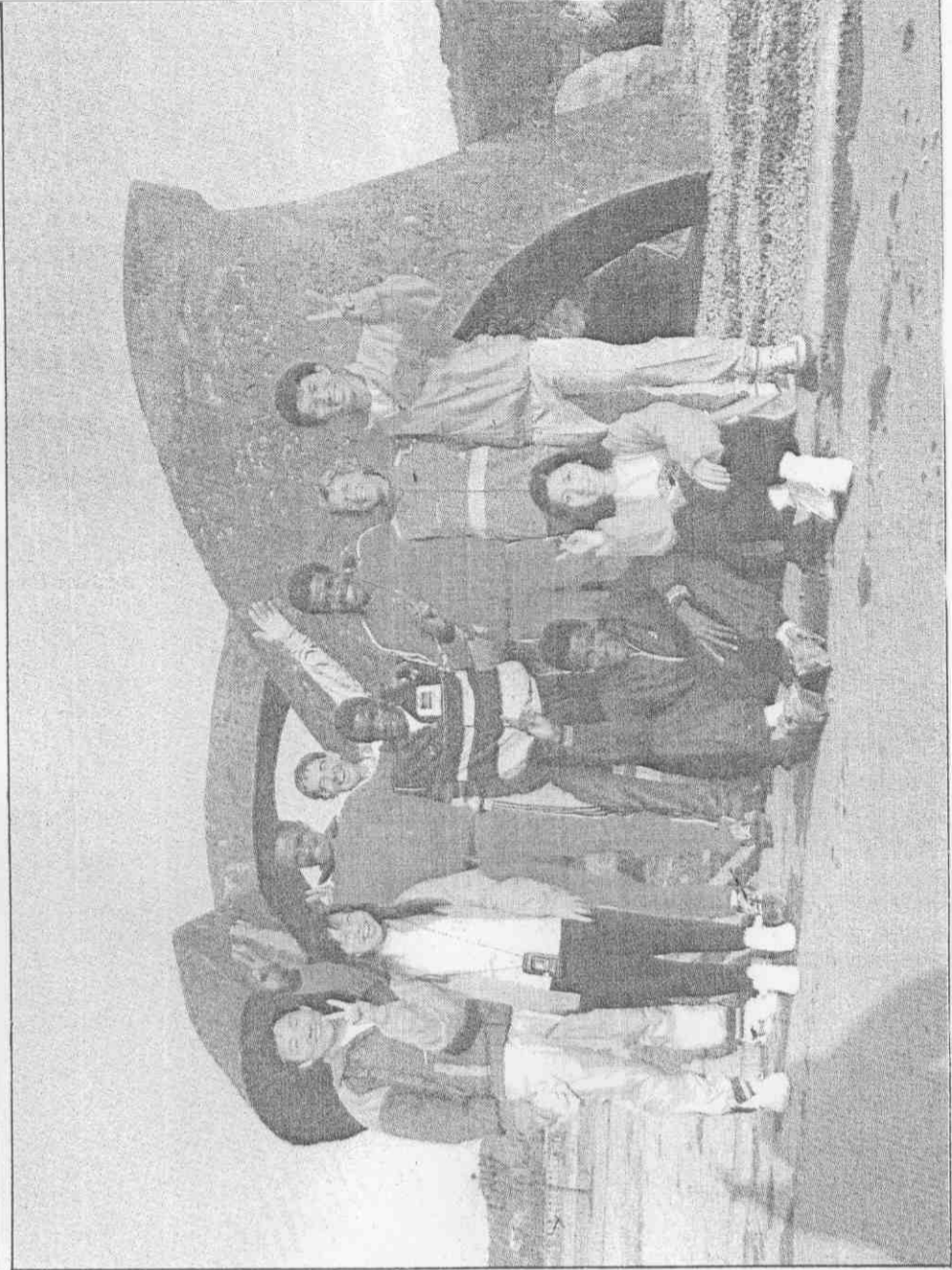
拉馬北台鼎問是，(左)潘拉特馬手高一第那札波▲。一之手選門熱的軍冠松