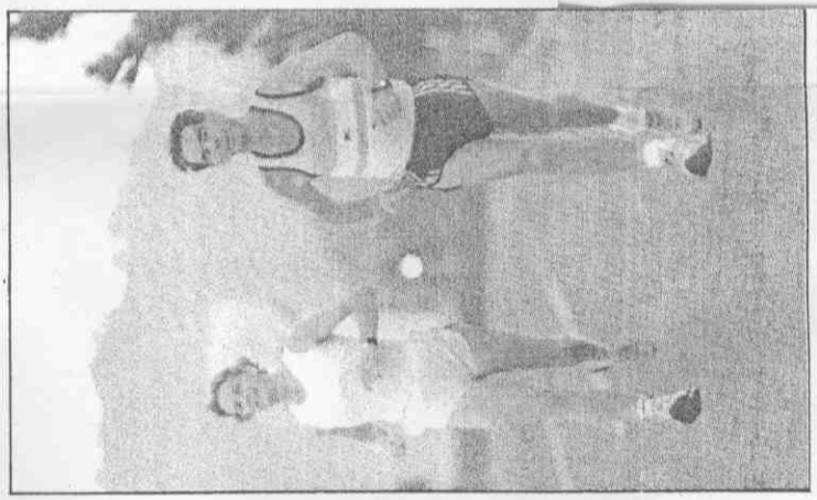
絲麗梅將女巴魯阿的練自師無▲。雷練教那波向斷不時跑練，(左) (攝興福張) 法方步步跑教請特

昨天下午由協原本安排這些選手參加中影文化城，但他們見到外雙溪附近環境幽靜，一時興起，又起一行人在故宮附近做了另一次短程練習。