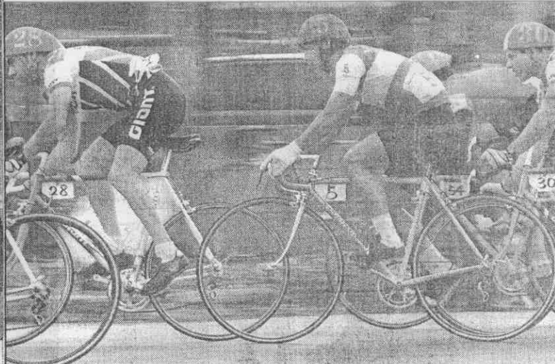
（中）荷蘭隊善者不來（左），韓國隊志在衛冕 今年戰況空前激烈。 （本報記者 鍾豐榮攝）