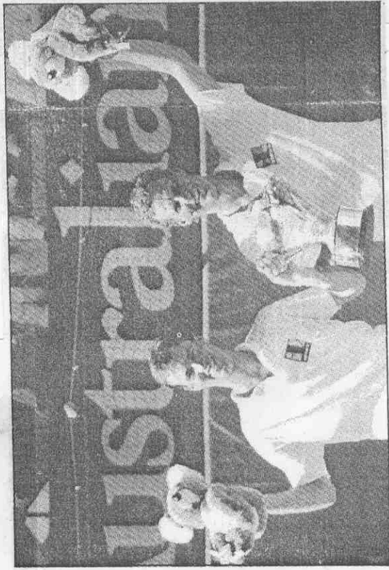
▲美國男網雙打選手李奇（左）與蒲伊（右），獲得男雙冠軍後，高興的共捧獎杯，並各高舉一個玩具無尾熊。