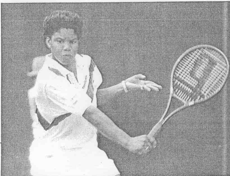
▲「隊火救」的會賽北台是爾妮克麥「頭車火色黑」