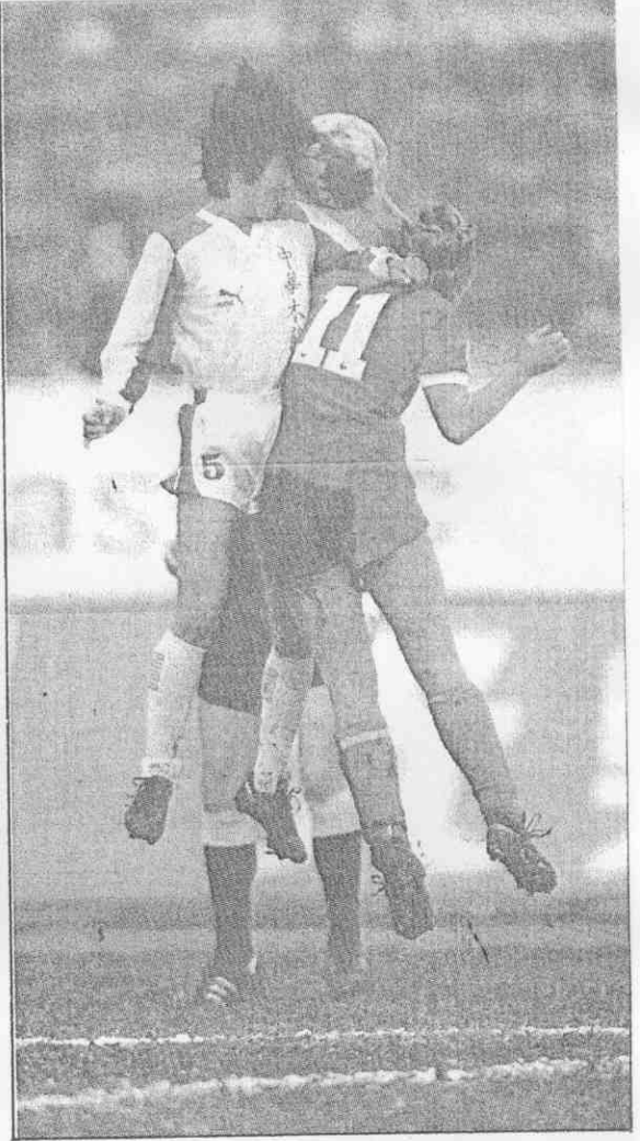
◀ 了球踢再不(左)蘭美陳將主衛後蘭木前