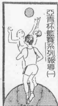
亞青杯籃球系列報導(一)

●第十屆亞青杯籃球賽，定本月廿四日至下月二日在菲律賓舉行，這是亞洲列強籃協今年行事曆上的第一件大事，大家無不希望討個好彩頭。特別是對籃球聲望幾乎跌入谷底的我國而言，今年的代表隊已被視為歷來最強的隊伍，其成敗不但維繫籃運能否振衰起敝，甚至關鍵著是否可以重振過去我國連拿兩屆邀請賽冠軍所建立的地位，以及