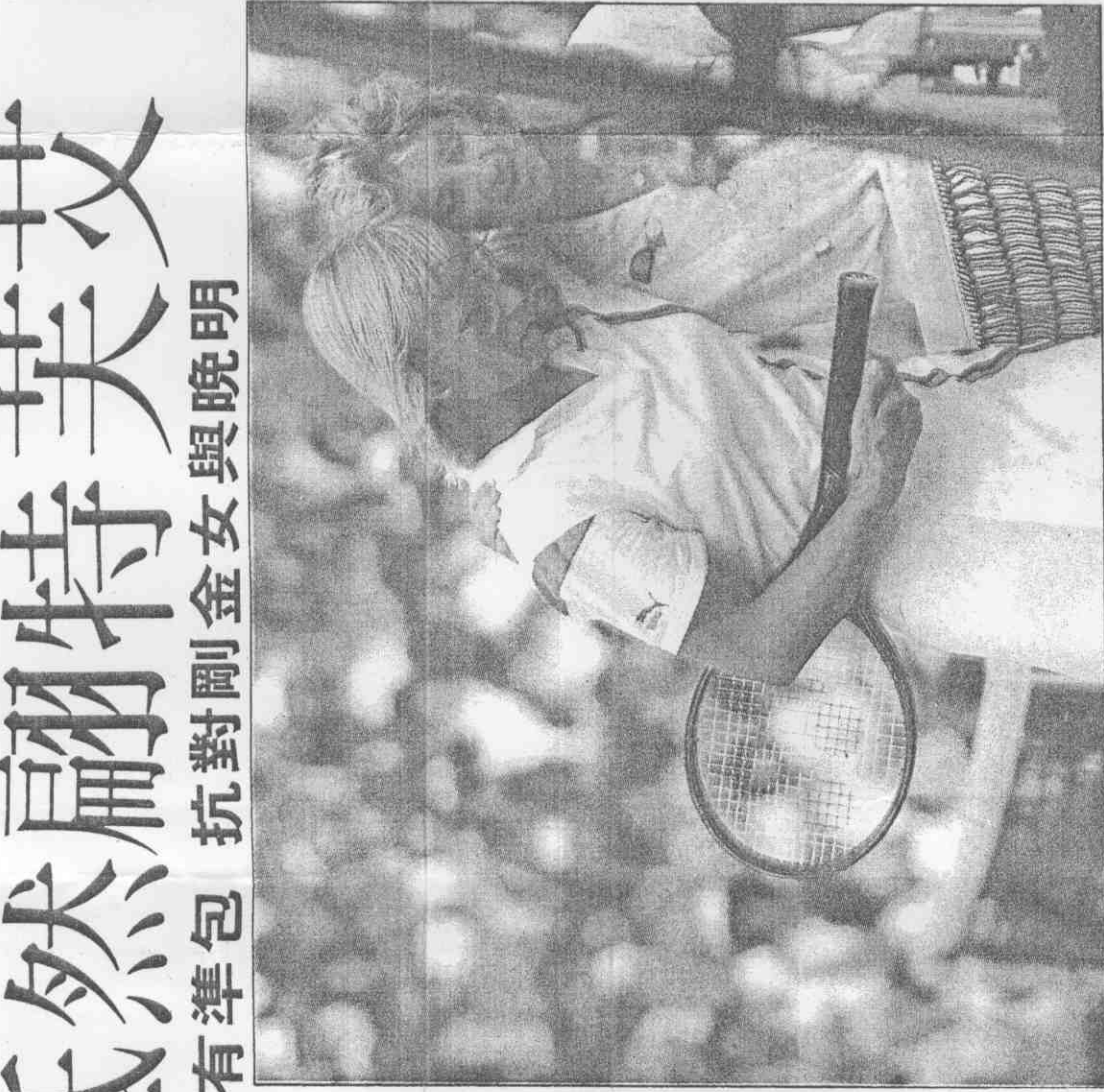
▲激烈的後，殺後(左)剛金女、(右)特芙艾、(左)剛金女、(右)特芙艾。場球出走擁相般妹姊如(右)特芙艾、(左)剛金女、(右)特芙艾。

【本報訊】懷著興奮、期盼的心情，美國網壇巨擘艾芙特在昨晚十時十五分翩然自美國佛羅里達家中飛抵台北。 明天晚上，艾芙特將和她的好友兼「宿敵」娜拉提諾娃於台北體育館演出一場她們傳誦世界網壇多年的對抗賽。 雖曾多次履跡亞洲，但前來台灣獻技，還是生平第一遭，艾芙特因而對此行充滿新鮮之感。尤其她的一歡喜冤家「娜拉提諾娃」和她一樣，也是首度來華，益發讓艾芙特深覺她們的「在台處女」作，將會格外精采。 不過昨晚是在經過卅個鐘頭的飛行後才到