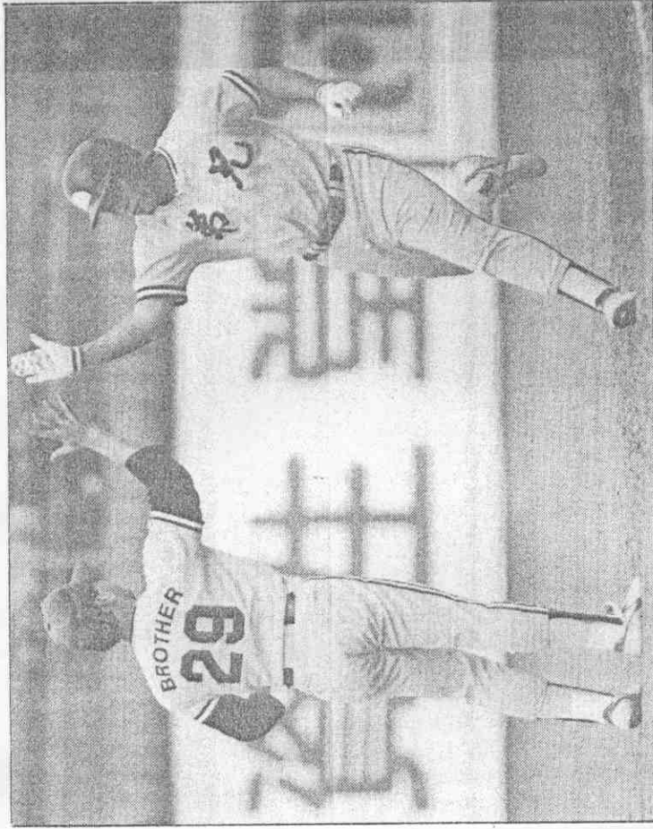
▲賀祝學擊他與豪仲江友隊，打壘全出擊亨百林隊弟兄，賽球棒日中 金陳手捕隊全味被前壘本在局四第，崎岡隊陸北海東本日，賽球棒日中 局出殺觸茂