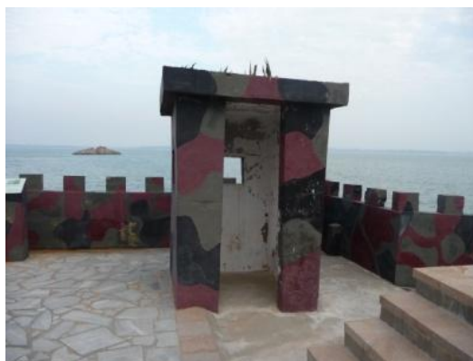
照片 2.12 油漆迷彩塗裝