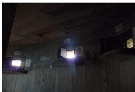
照片 2.4 將軍堡射擊口