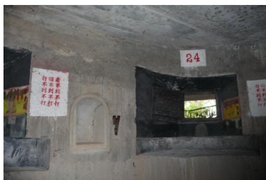
照片 2.3 將軍堡射擊口