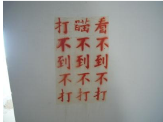
照片 2.14 字模噴漆