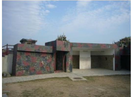
照片 2.22 油漆迷彩塗裝