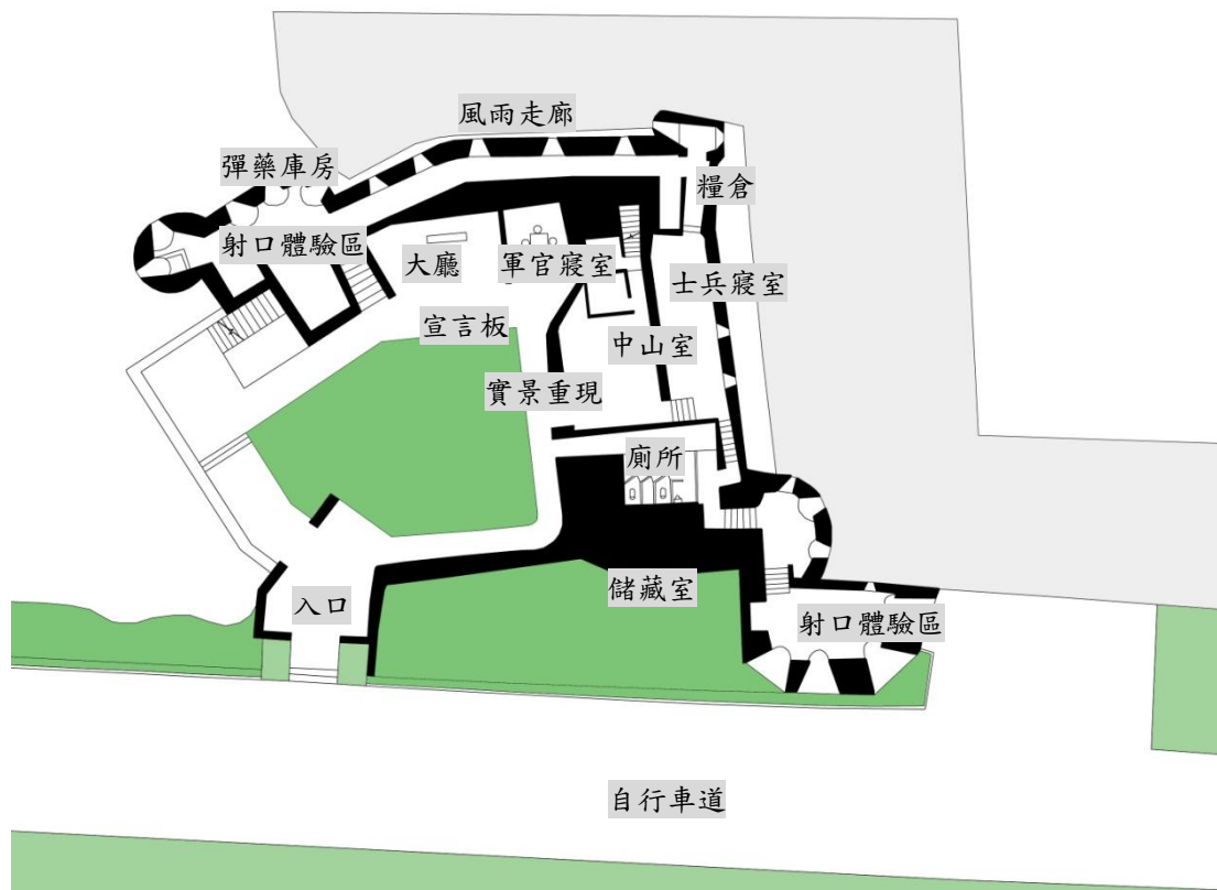
圖 3.1 將軍堡一樓平面圖