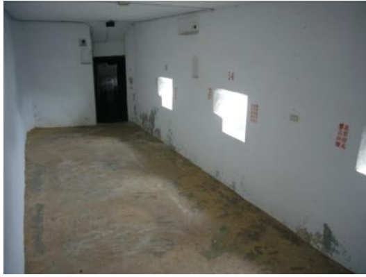
照片 3.3 官兵寢室