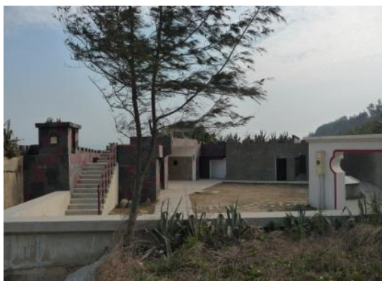
照片 2.11 混凝土灌漿