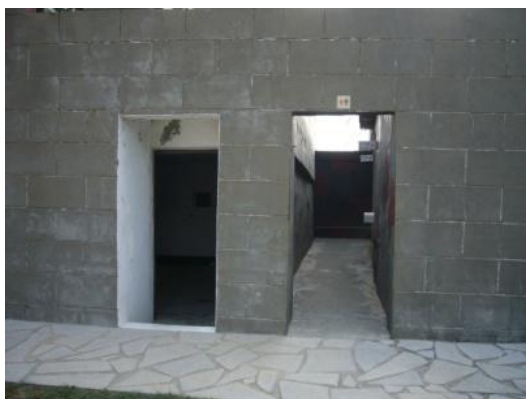
照片 2.7 PC 路面