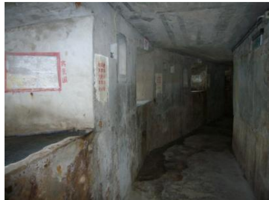
照片 2.24 混凝土灌漿