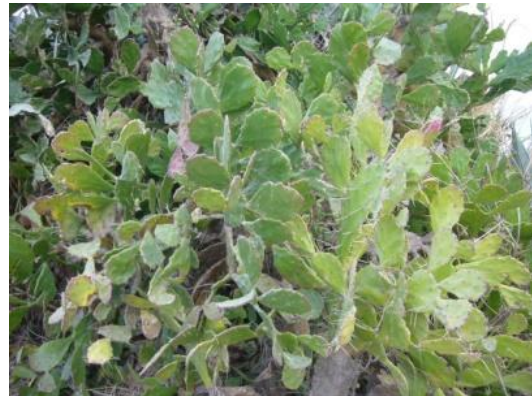
照片 2.6 仙人掌