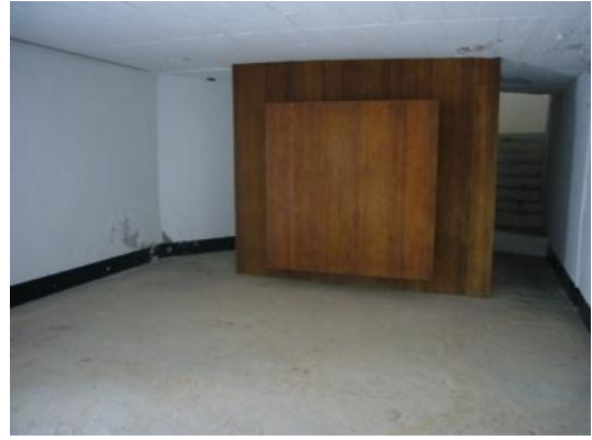
照片 3.4 中山室