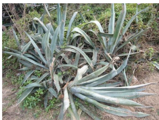
照片 1.1 龍舌蘭

有關金門的禦敵植物之前被誤認為是瓊麻（瓊麻亦屬龍舌蘭科），根據研究調查應為「龍舌蘭」而非「瓊麻」。兩者中最大差別在龍舌蘭的葉邊具銳刺，而瓊麻頂端具黑刺，但葉緣無刺或具少數鋸齒 3 。