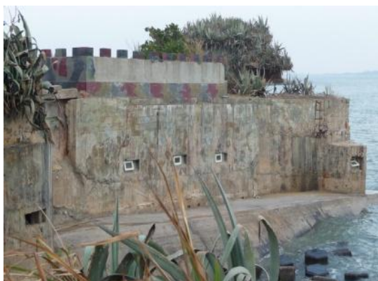
照片 2.10 混凝土灌漿