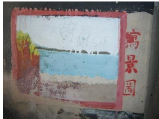
照片 3.2 寫景圖