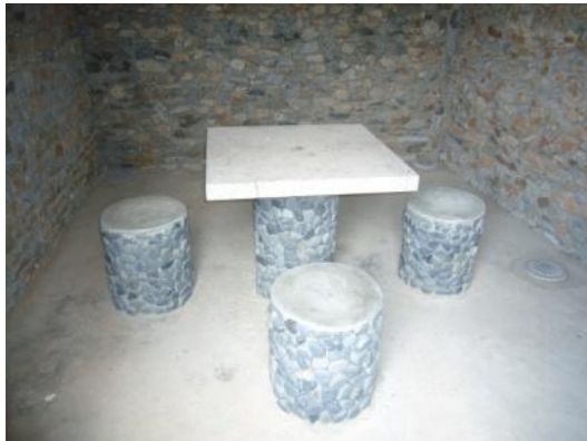
照片 3.5 蔣、郝會面地點