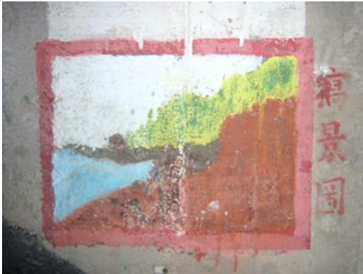
照片 2.13 彩繪