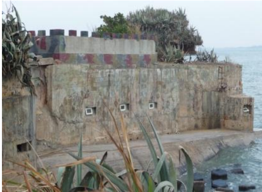
照片 2.21 混凝土灌漿