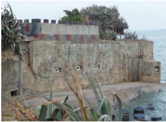
照片 2.20 混凝土