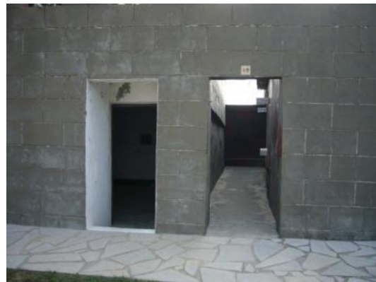
照片 2.16 混凝土