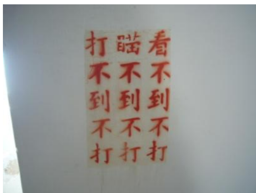
照片 3.7 三不政策

士氣，主要目的在鞏固我軍意志與信念，使國軍確知為誰而戰，為何而戰，藉以同仇敵愾，進而求取勝利，達到實現國家統一目標。將軍堡最常看到的標語為三不政策「看不到不打、瞄不到不打、打不到不打」兩岸敵對狀況較為緩和後，國軍為精簡彈藥使用之射擊準則。