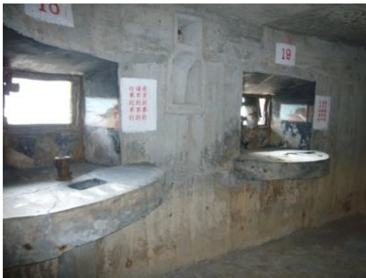
照片 3.1 射擊口

將軍堡位於小金門後頭地區，由九宮碼頭上坡後，從烈嶼環島自行車道約 2.6 公里處。將軍堡原為烈嶼守備區的 L-55 排據點，興建在海濱，碉堡為 L 型，共分上下兩層，下層外圍共有 24 個射擊口，北面可監控金門港灣，南面可監控金烈水道海域，士兵藉由多處的射口捍衛將軍堡安全，並藉由寫景圖的輔助精準的瞄準敵軍，內層為官兵寢室，士兵曾在此養精蓄銳，而當時中山室是召開會議及平日士官兵用餐交誼的地方。在中山室旁是由於八二三砲戰期間，蔣經國曾偕同王昇、柯遠芬二位將軍自水頭乘登陸艇抵烈嶼慰勉守軍，並在砲火聲中與當時第九師師長郝柏村少將會商軍機於這個碉堡內，官兵在蔣、郝會面地方建立紀念性據點。上層視野遼闊，自大金門的水頭碼頭一直到慈堤的西部海岸線一覽無遺，因此設有崗哨監控大金門西面海域動向，近年來由於國軍經實案，部份軍隊撤走，而成為空置據點。民國 92 年由金管處接收，依原貌修復規劃為小型軍事博物館，重現當時駐防設施。