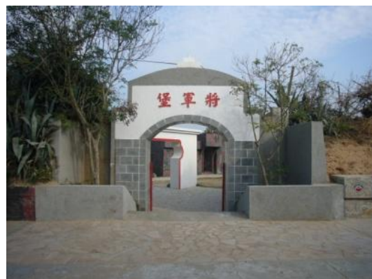
照片 2.8 石材