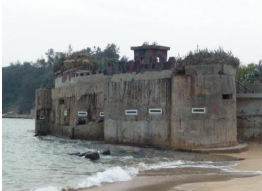
照片 2.25 混凝土灌漿