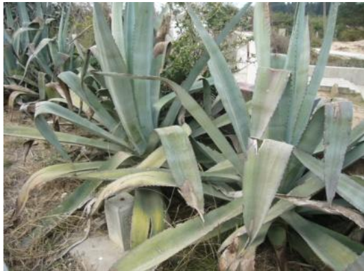
照片 2.5 龍舌蘭