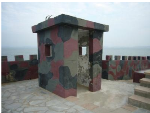
照片 2.9 迷彩塗裝