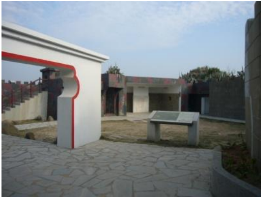
照片 2.17 混凝土灌漿