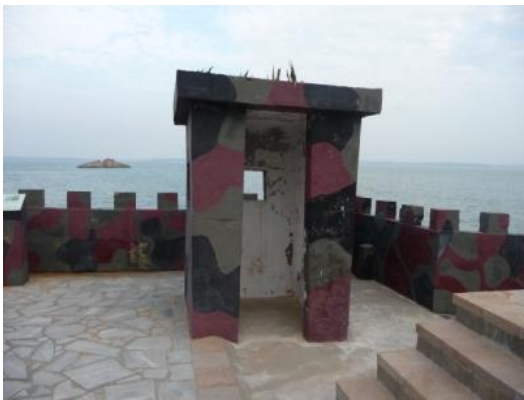
照片 2.18 入口崗哨