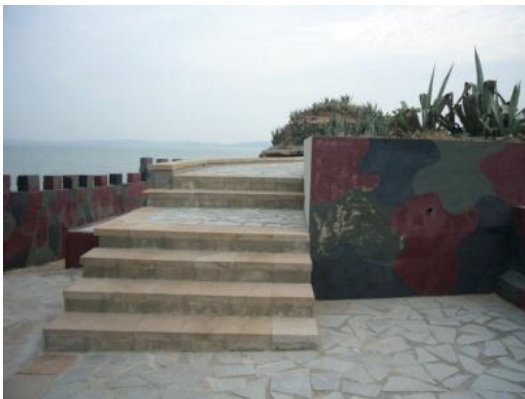
照片 2.15 石材鋪面