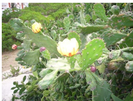
照片 1.2 仙人掌