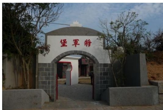
照片 2.1 將軍堡入口

近年來為發展金門觀光，振興經濟發展，在金管處積極的向軍方爭取後，於民國 92 年 2 月金防部同意釋出以充實國家公園的戰役史蹟資源，移撥給金門國家公園管理處，金管處斥資新台幣七千萬元進行小金門環島車轍道及週邊景觀美化工程，其中將軍堡整修列為施工計劃之一，民國九十三年正式開放，隨後依原貌修復規劃為小型軍事博物館，重現當時駐防設施。