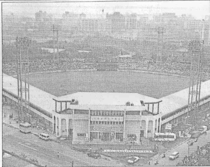
。新一修整場球棒德立