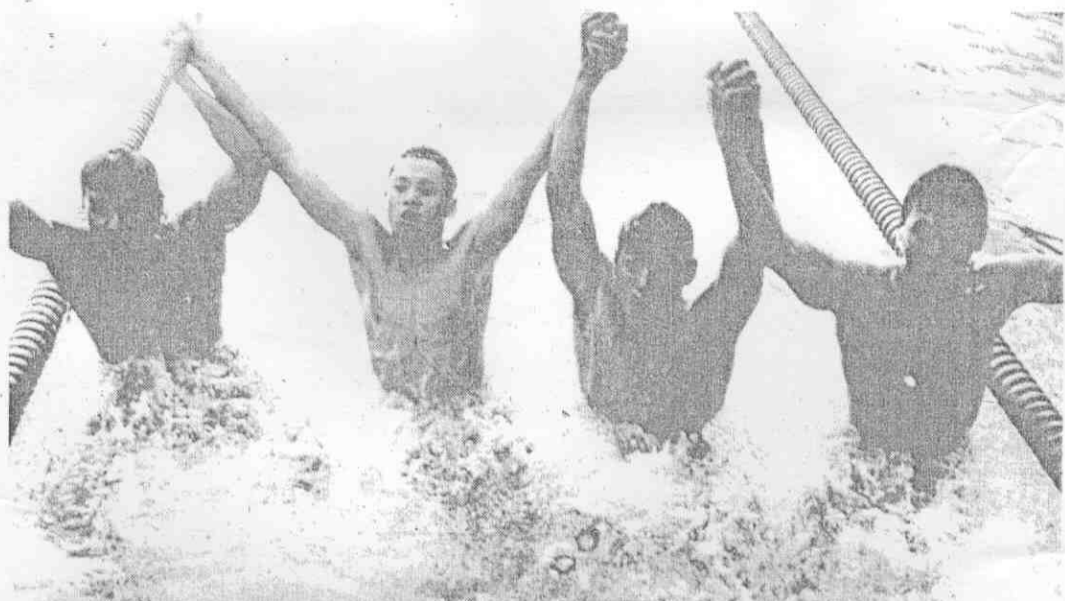
文益丁、男辰會、麟大李起左，手選名四的錄紀國全新刷隊北市高力接式由自尺公400子男賽泳運區 (攝組小影攝運區報本)。杓牟、