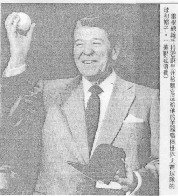
雷根總統手持密蘇里州檢察官送給他的美國職棒世界大賽球隊的球和帽子。