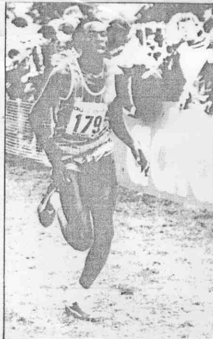
肯亞的納古齊贏得世界越野錦標賽冠軍。