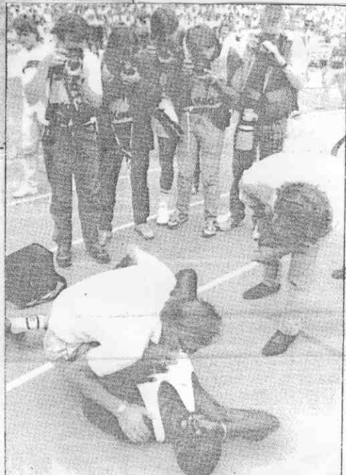
◀強生以九秒九五贏得一百公尺短跑後，撞上一位攝影人員未經許可置放在場中的攝影三角架，受傷倒地。