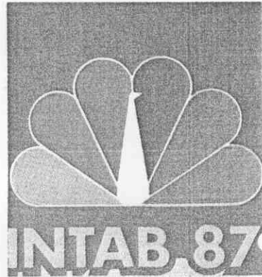
。誌標賽球桌界世屆九十三第