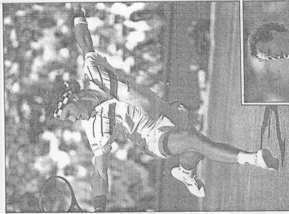
▲凱西，有可能再次稱霸溫布頓嗎？

而一九八五年以非種子身分「異軍稱王」的貝克，在八六年衛冕成功後，被網界視為草地球壇天才，不料卻在八七年的第二回合慘遭名不見經傳的澳洲球員杜漢修理。今年貝克抱定決心捲土重來，一高前並在女王俱樂部網賽奪魁，顯示他在草地球壇上的實力。加上一九八一、八三、八四、八五、八六、八七、八八、八九年曾三獲溫布頓冠軍的火爆小子馬克安諾，在睽違兩年後，重新投入這個戰場；去年以「爆冷」姿態奪冠的凱西圖衛冕，今天開打的第一百零二屆溫布頓大賽，能不能在未來兩個星期內，於全世界掀起網球熱潮？