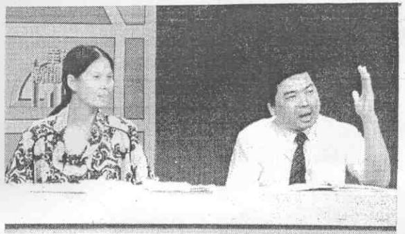
郭和(左)政紀的部育體立設成贊 (攝源明林 者記報本) (左