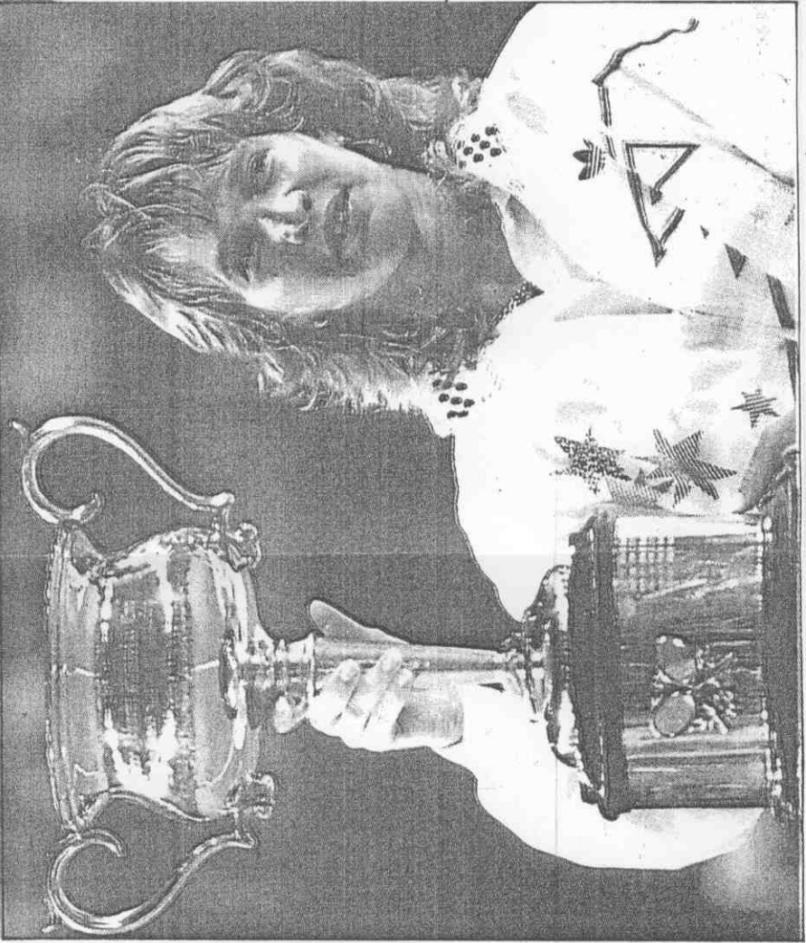
▲舉著第三度奪獲的澳洲公開賽冠軍杯，韋蘭德為今年的征戰打出好的開始。