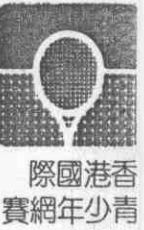
香港國際網壇少年