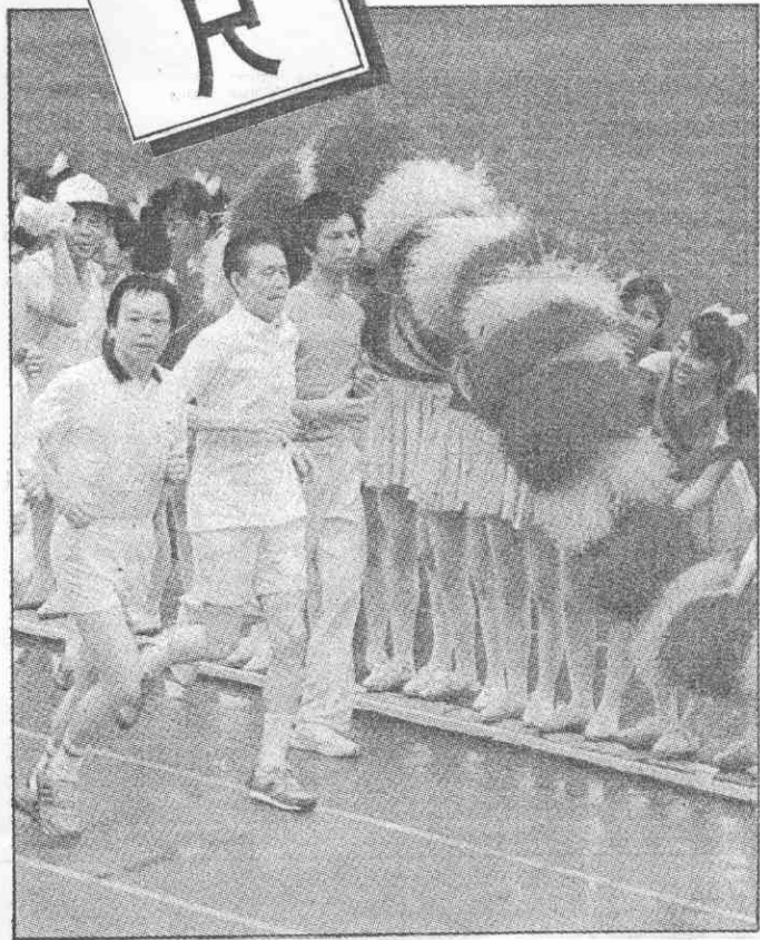
啦啦隊揮舞彩球加油，王永慶穩健邁步跑完五千公尺。

【本報訊】儘管斜風細雨，氣溫低寒，一襲白色短袖衣褲的台塑企業董事長王永慶，昨天在台塑運動會五千公尺競賽，不畏風雨，以穩健步伐，跑出二十九分三十三秒零六的成績，為運動會掀起高潮。台塑關係企業第十二屆運動大會，昨天在明志工專舉行，有台塑海、內外十四個單位及內政部警政隊、明志工專畢業校友隊，計十六個單位，三千兩百餘人參加。