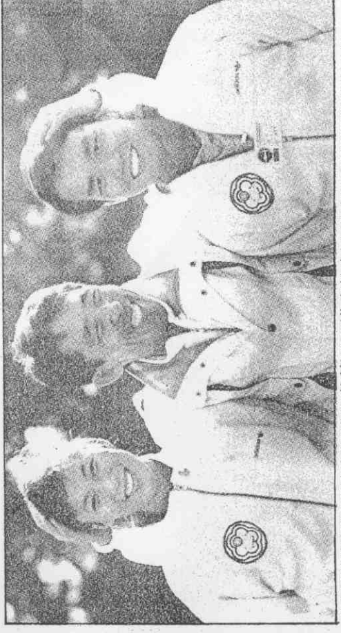
(左)美芳賴的牌獎面兩獲各著捷的面滿容笑(中)鐸亨金練教籍韓隊華中↑(真傳平北威國胡 者記派特) 坤炳邱與