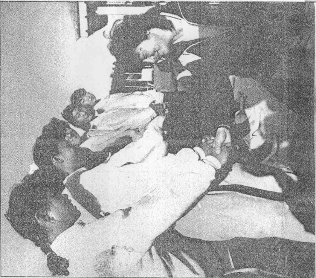
賀道們她向(右)員隊陸大，後名二第體團得獲組子女隊華中賽箭射洲亞↑(真傳平北威國胡 者記派特)

●中華擊劍隊在抵達大陸北平的第二天晚上，就大舉租了九輛腳踏車，過了個愉快的晚上。 九位男女劍手向飯店租了九輛腳踏車，從麗華飯店一路騎到天壇。腳踏車在大陸是再普通不過的交通工具，中華隊的劍手卻大都不諳此調久矣，特別覺得刺激好玩。(真傳平北威國胡 者記派特)