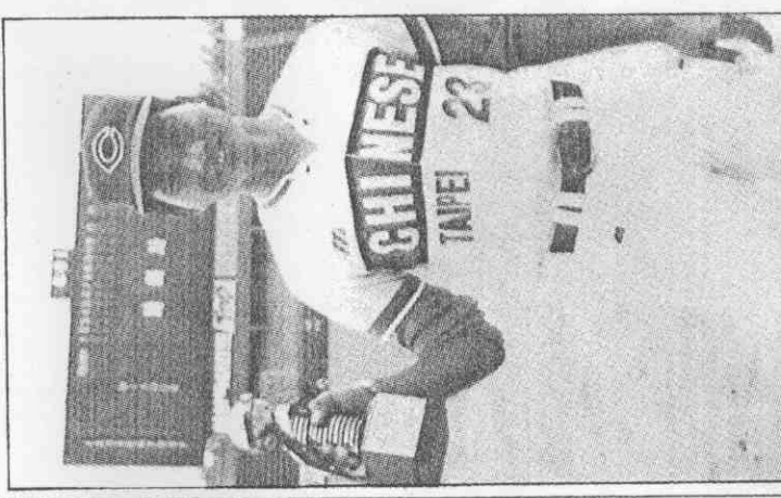
獲杯洲亞在，堂榮龔的隊華中。獎擊打佳最得。