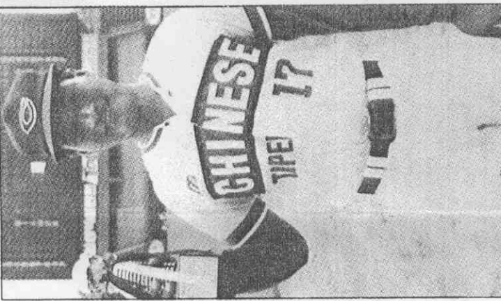
獲杯洲亞在，義忠黃的隊華中。獎「套手金」備守佳最得。

【本報訊】十六位外籍職棒選手，昨天和中華職棒球隊簽約，正式加入三商、兄弟隊，全及統一隊，明年三月十七日起在我國職棒比賽中亮相。 這十六位選手中，有五位美國籍、四位多籍、兩位巴拿馬籍、五位擁有「綠卡」的拉球員。 昨天的簽約儀式在兄弟飯店舉行，除味全