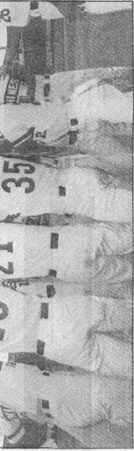
↑賀慶中空到拋發來李練教總將得奮興，後軍冠杯洲亞得獲在隊華中

外籍職棒選手的合約以兩年為一期，年薪三萬六千元美金，每年球季結束後，可以返國休假一個半月。我國職棒籌備會執行長洪騰勝，昨天致贈每位選手美金一百元。十六位入選和七位落選的外籍職棒選手，今天各自返國。