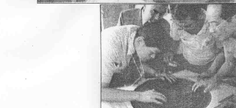
↑有一，次名關相分分績成賽擊射 。「審會」合集刻立判裁有所，問疑