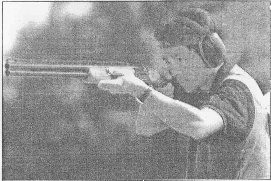
牌金人個靶飛向定不下射法槍確準以，介義黃手射隊華中