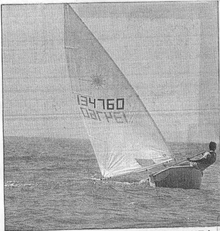
↑雷射帆船我是國實力最好的船型。

原本大陸方面答應我國選手可以租用當地的船隻比賽，結果前晚又變卦，風浪板選手們必須自備器材，又增加承辦人許多工作，也得負擔運費，好不容易到今天終於要成行，帆船工作人員總算稍稍鬆了一口氣。