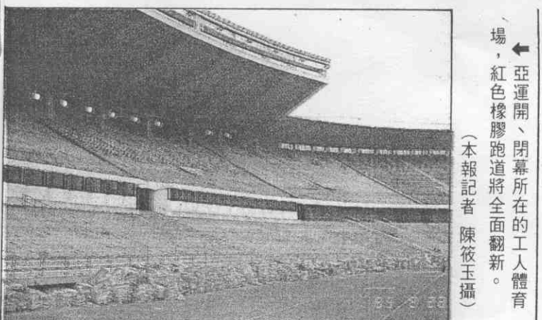
亞運開、閉幕所在的工人體育場，紅色橡膠跑道將全面翻新。