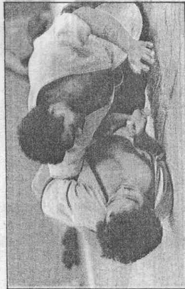
↑ 戲好手拿是角摔，揚昂志闊、沛充能體胞山。座叫又好叫，觀壯場面場賽比河拔↓