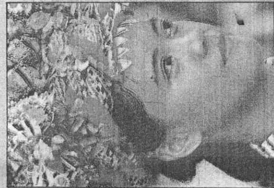
與參情熱 於妝重慎 ●山地運動會是一 全良參與」的典範， 山胞無分老少男女都 熱烈參與，全場迸發 熱情與活力。 右圖盛裝老嫗來自 屏東深山部落，年紀 高達九十二歲，依然 身著麻織紋飾傳統華 服，頭戴龍鳳帽飾前 來赴會，和參加「豐 年」祭一樣隆重；與 左圖的妙齡少女一樣 傳達山胞對「山胞運 動會」的憧憬。 豐年祭表達對天的 敬意，山運會則象徵 山胞維繫傳統文明的 努力，心境並無二致， 只是山運會結合體育 與文明，更具「力與 美」特色。